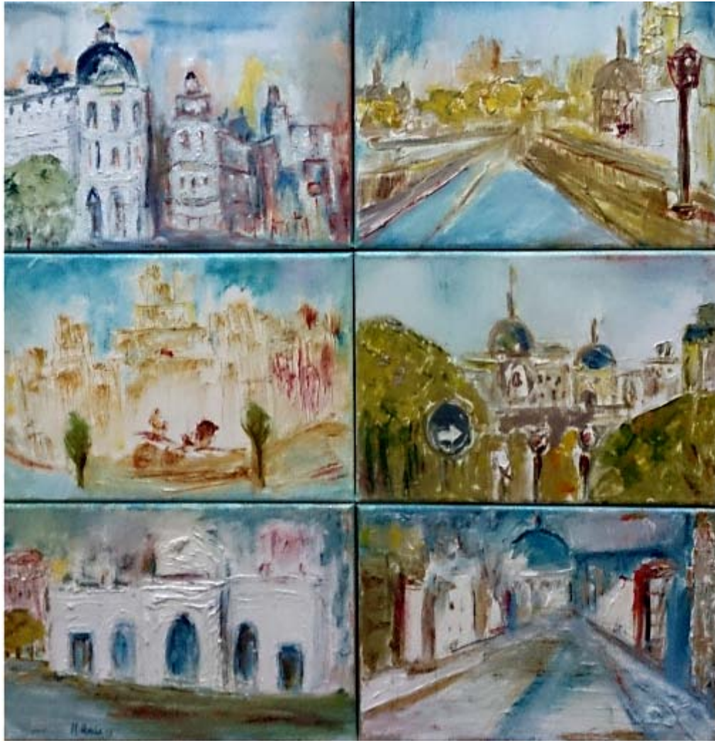
Mavi Recio "Madrid" Óleo / lienzo 56,50 x 54