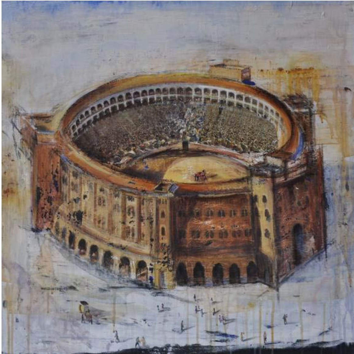
Macarena Candrian "Horas contadas" Mixta / lienzo 70 x 70