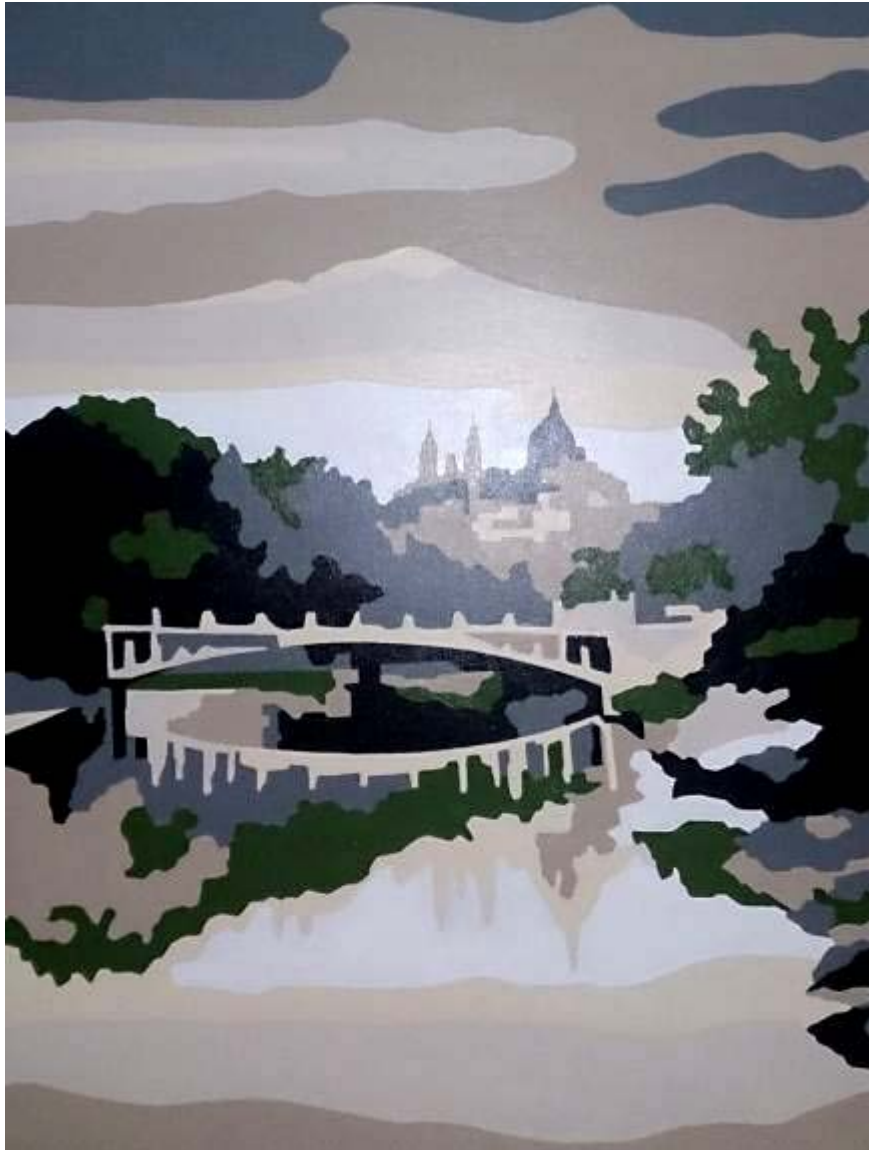
Jesús Torres Granado "Puente de la Reina Victoria" Acrílico / lienzo 65 x 50