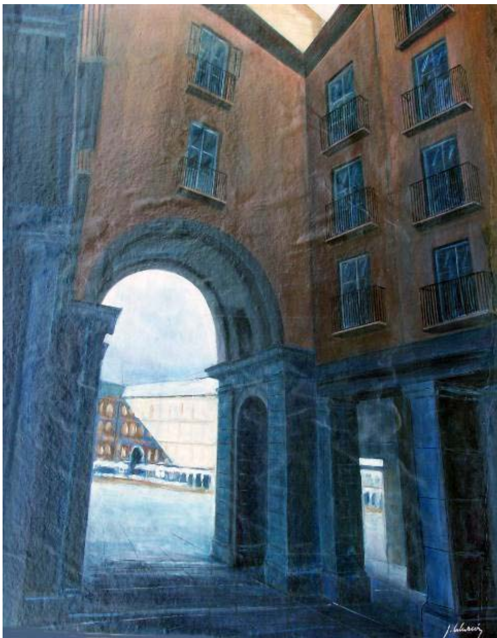
Joaquín Alarcón González "Entrada a la Plaza Mayor" Óleo / tabla 72 x 59