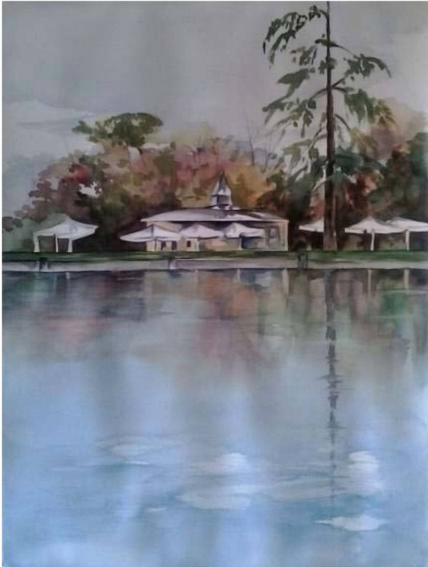
Carmen Durán “Merendero en el lago de Retiro” Acuarela / papel 76 x 56