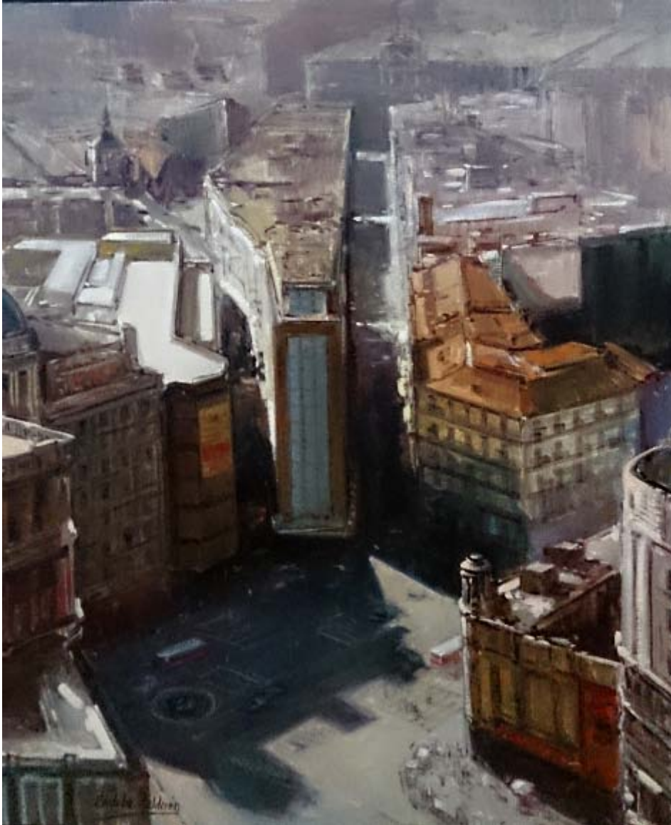
Ramón Córdoba Calderón "Plaza de Callao" Óleo / lienzo 73 x 54