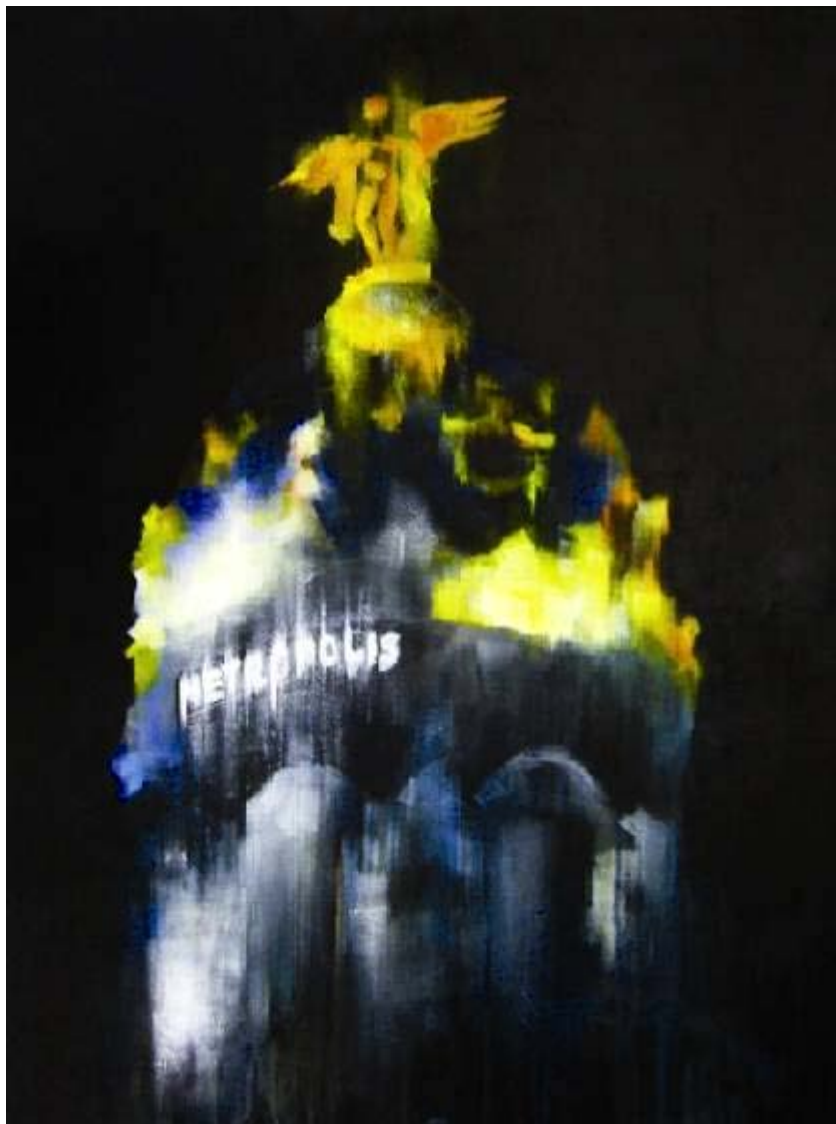
Adriana M. Berges "Cúpula Metrópolis" Acrílico / lienzo 65 x 50