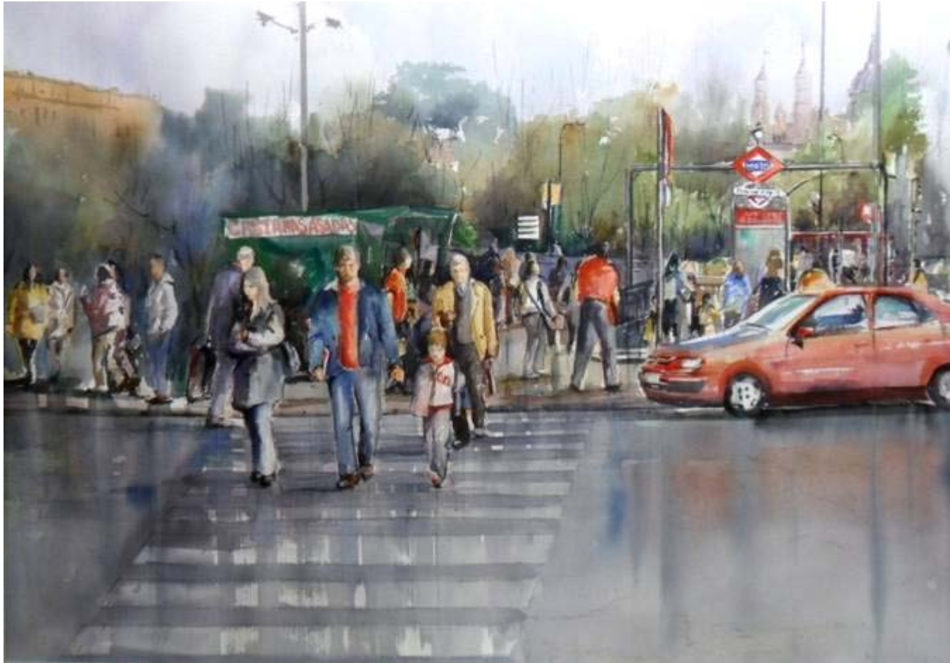
Victoria Moreno "Castañas asadas" Acuarela / papel 55 x 80