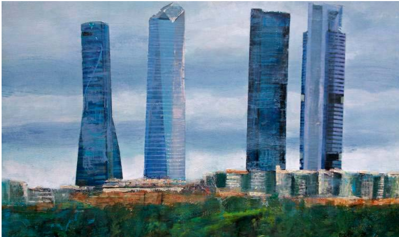
Mª Pilar Fernández Antón "Miradas de Madrid" Mixta / lienzo 80 x 80