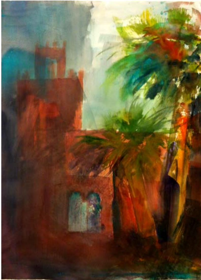
Joselina Rivera "Vistas del Lago de la Casa de Campo" Acuarela / papel 72 x 102