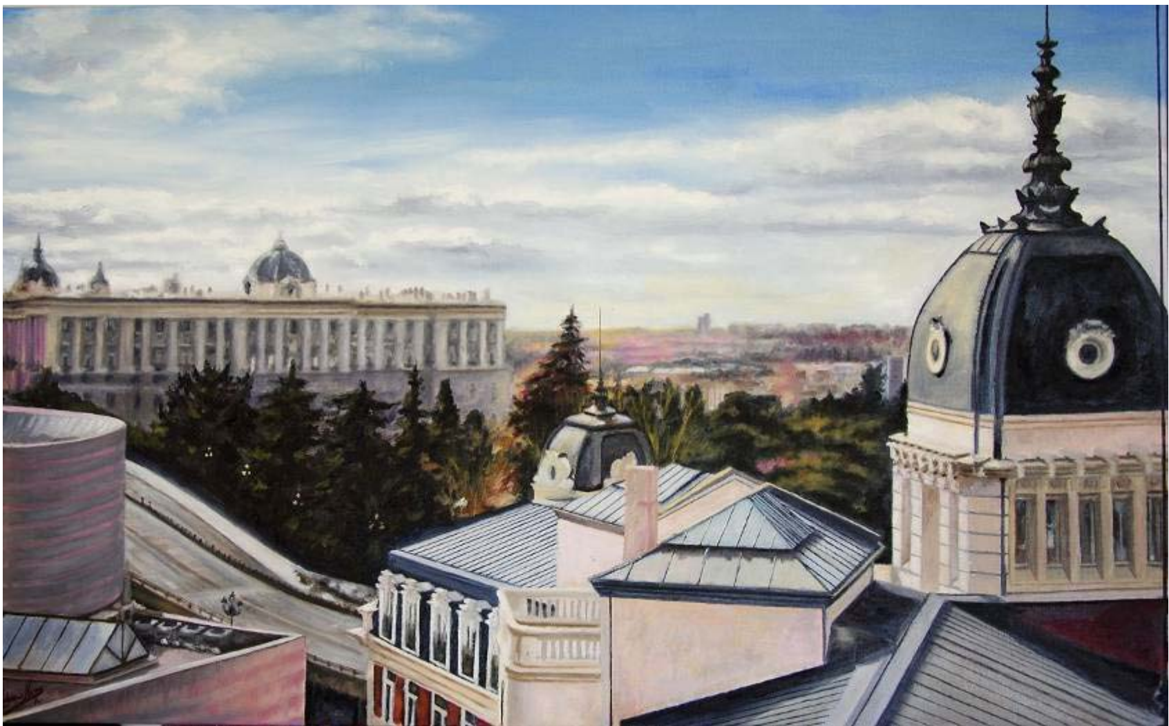
Guadalupe Alonso "A vista de gato" Óleo / lienzo 50 x 81