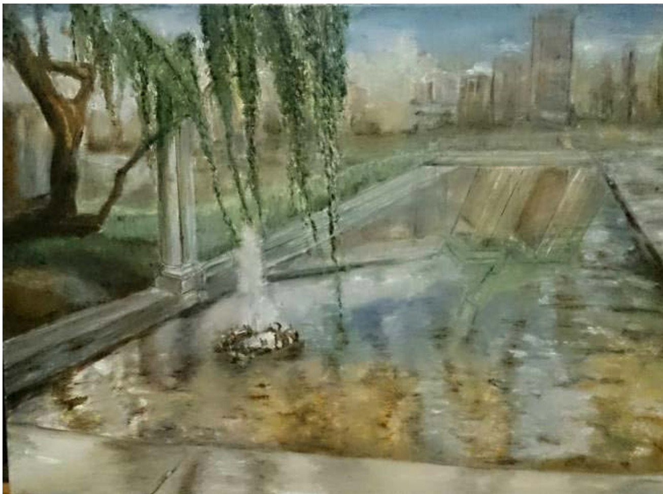
Ángela Palomeque Messia "La naturaleza en Pº de Recoletos" Óleo / lienzo 60 x 80