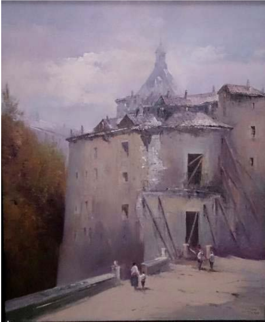
Ricardo Montesinos Mora "Antigua casa del pastor (Madrid)" Óleo / lienzo 73 x 60