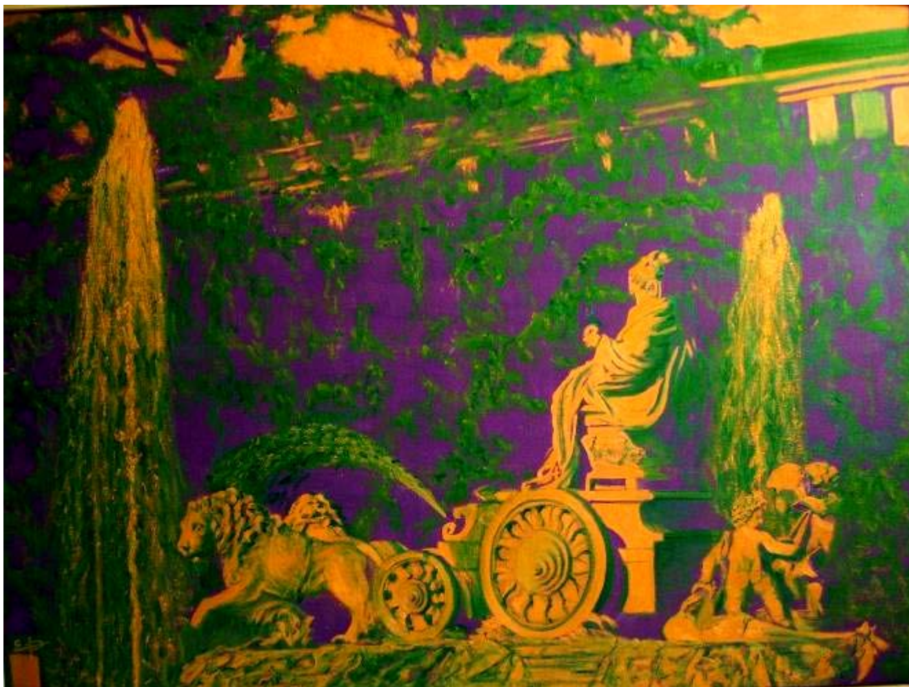
Elena Pérez Abel de la Cruz "Fuente La Cibeles" Óleo / lienzo 60 x 81