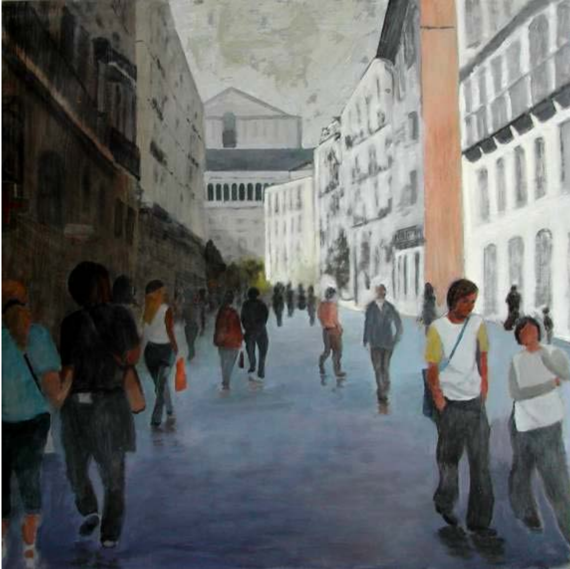
Emilio Sotomayor "Ópera" Mixta / tabla 81 x 81