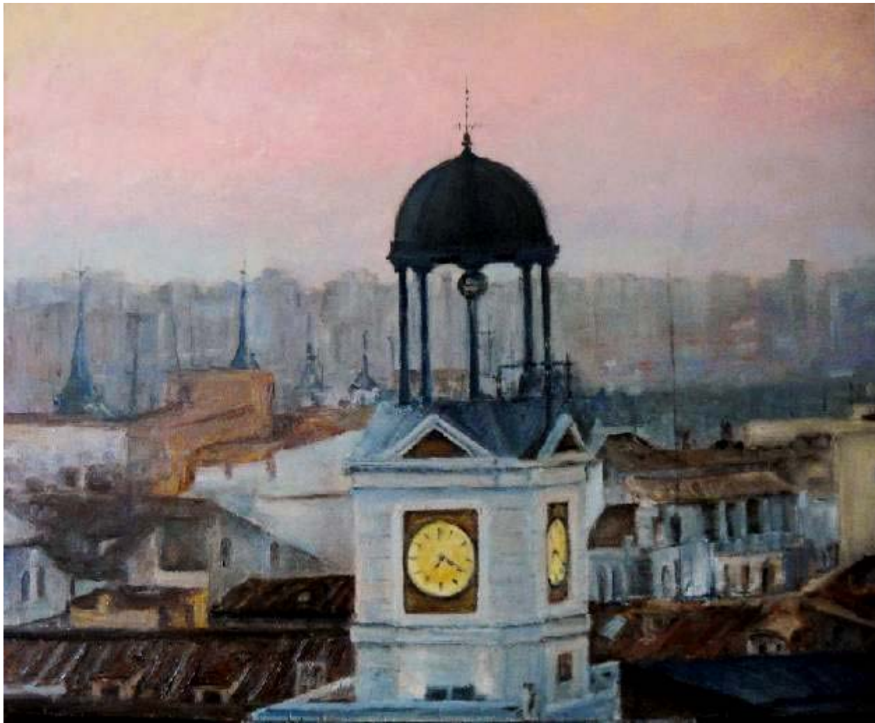
Mª Isabel Flórez Bielsa "Tejados de Madrid I" Óleo / lienzo 50 x 61