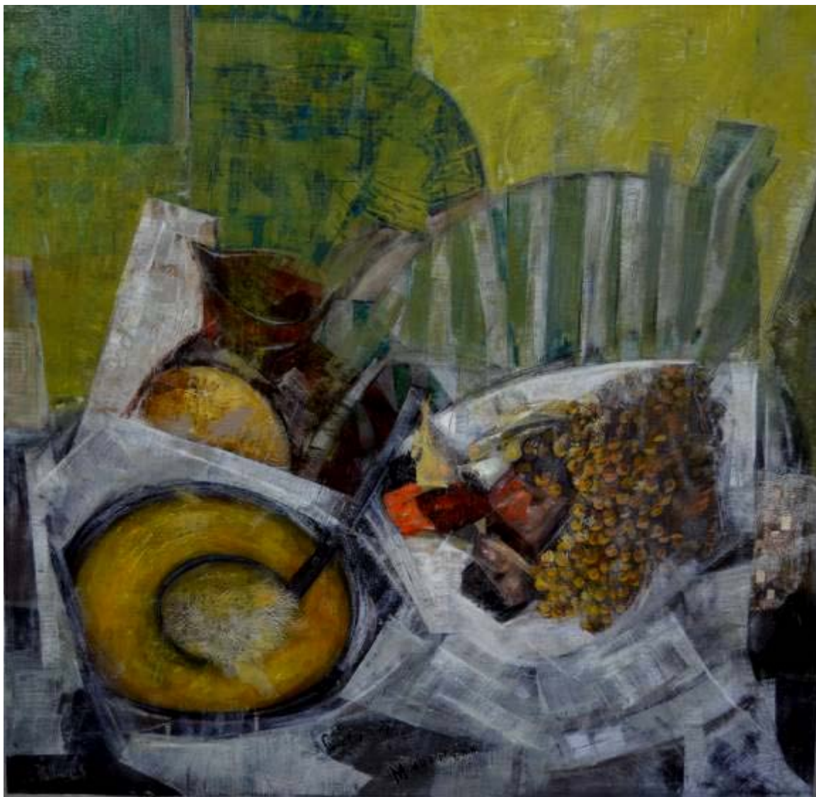
Juan de la Cruz Pallarés "Cocidito Madrileño" Óleo / lienzo 80 X 80