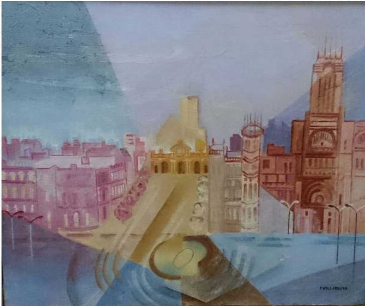
Juana Villanueva "Plaza de Cibeles" Mixta / lienzo 54 x 65