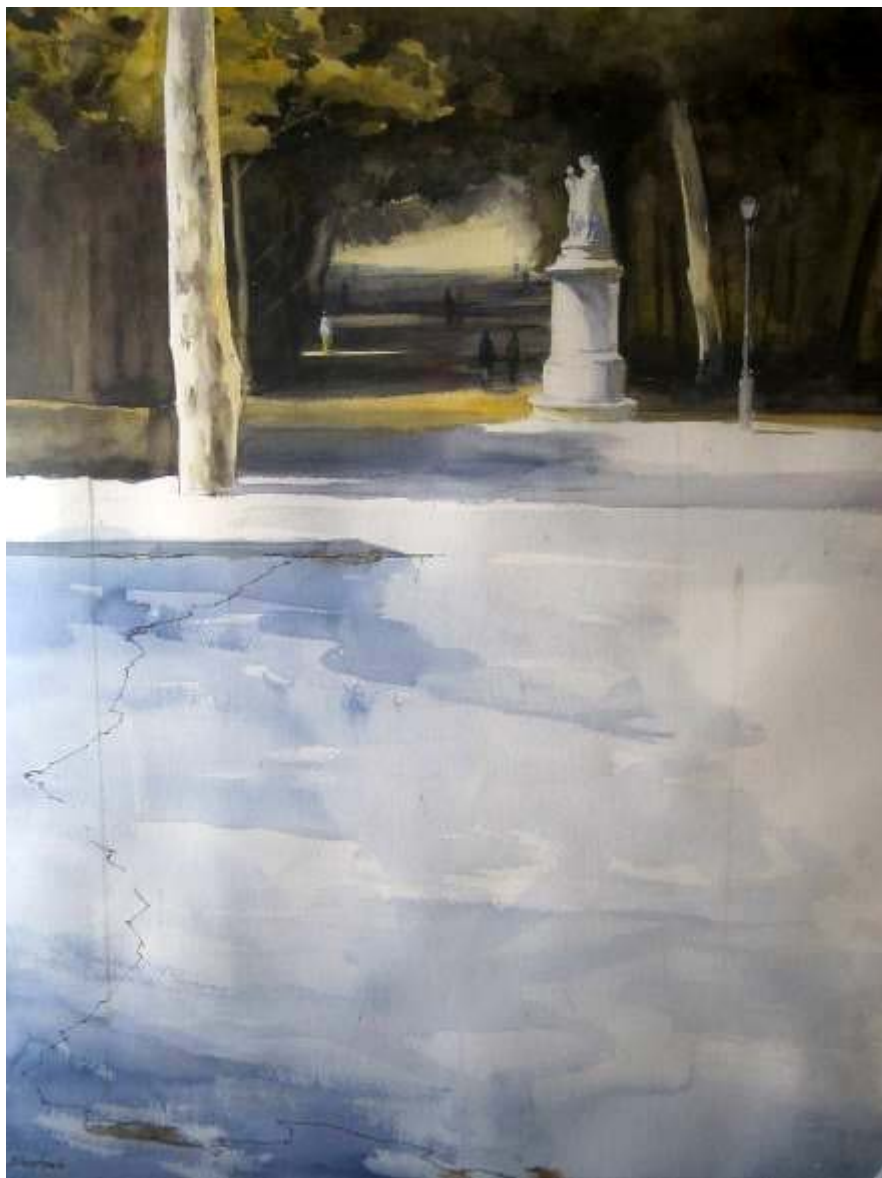
Francisco Bertrán Hernández "El Retiro" Acuarela / papel 56 x 73