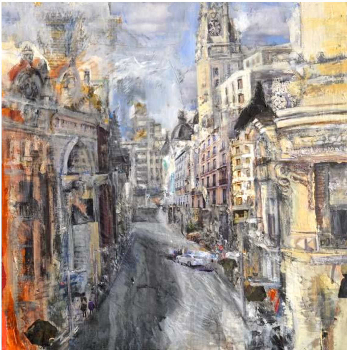
Macarena Candrián "Gran Vía" Mixta / lienzo 50 x 50