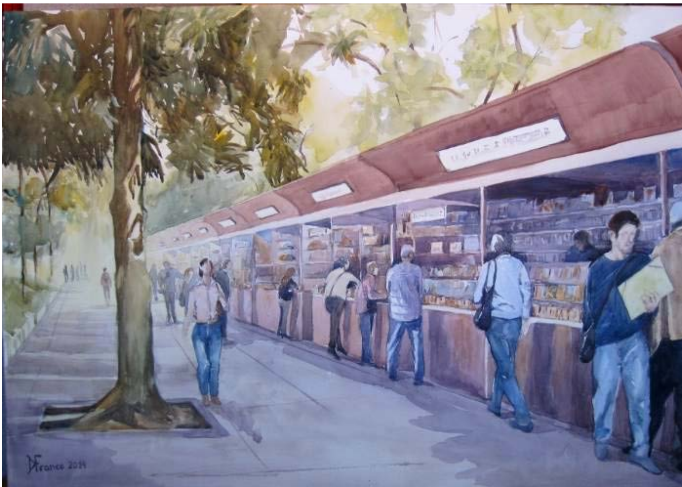
Dolores Franco "Feria del libro antiguo" Acuarela / papel 50 x 73