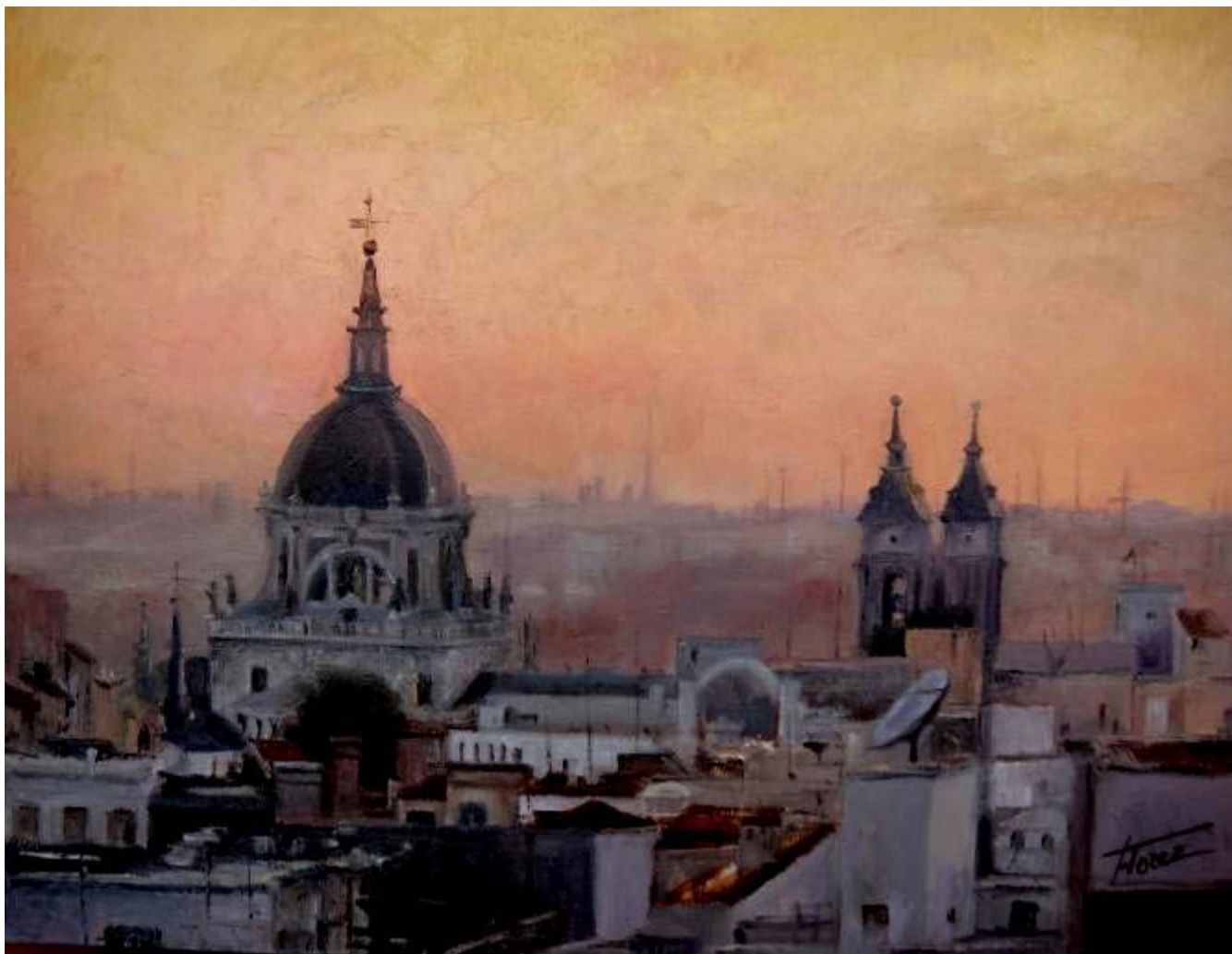
Mª Isabel Flórez Bielsa "Tejados de Madrid II" Óleo / tabla 50 x 61