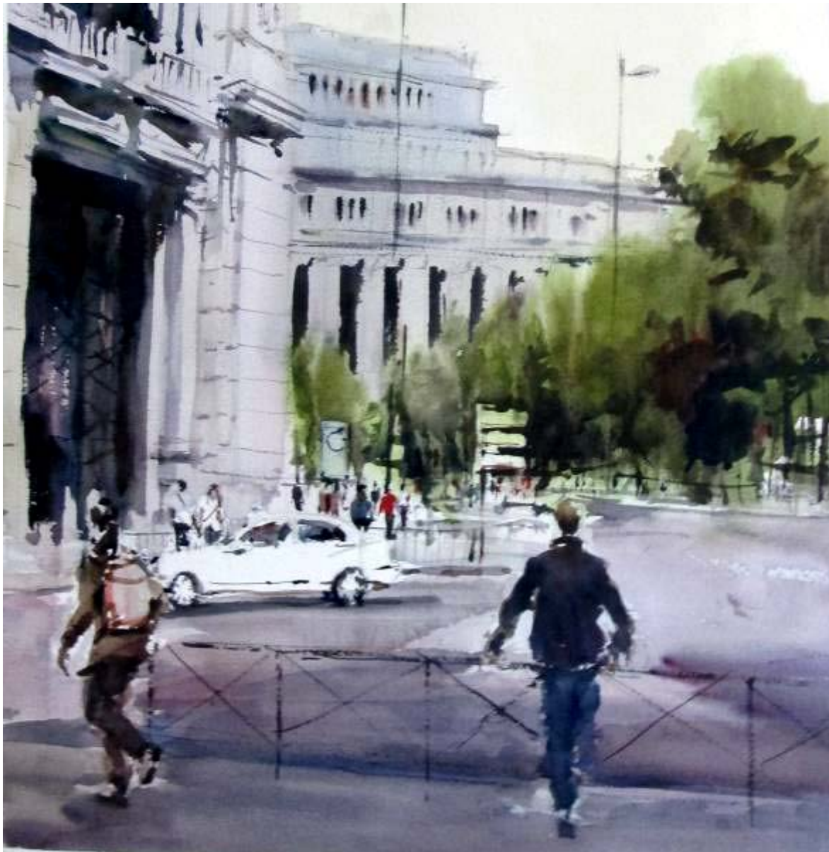
Javier Zorrilla "Esquina del Banco de España" Acuarela / papel 50 x 50