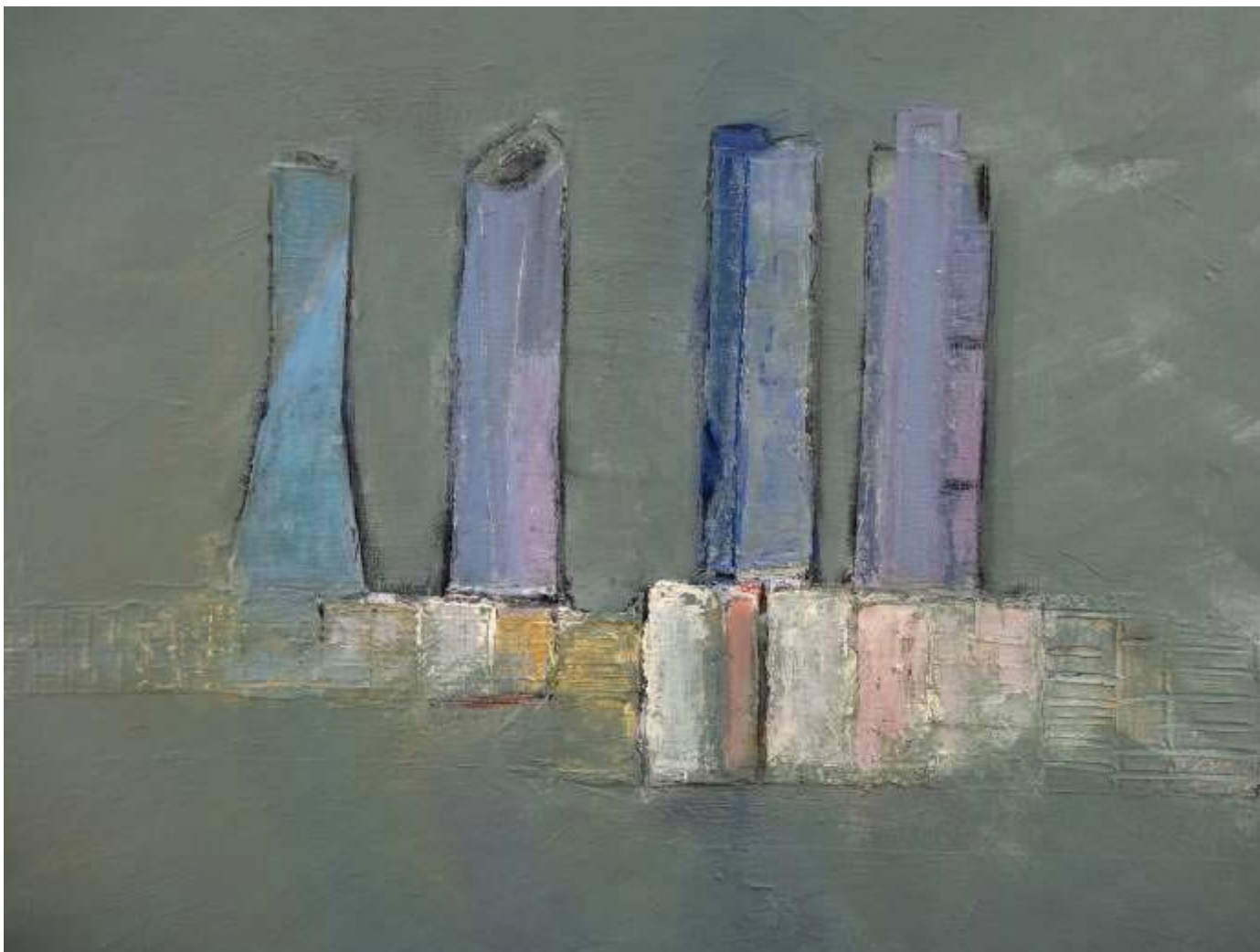
Mª Pilar Fernández Antón "Entre brumas" Mixta / lienzo 60 x 60