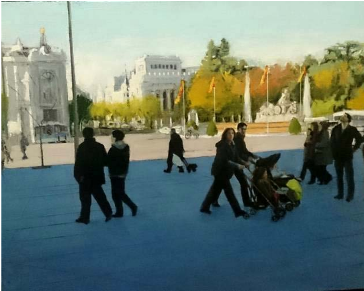
Juan Manuel López-Reina "Madrid dominguero" Óleo / lienzo 65 x 81