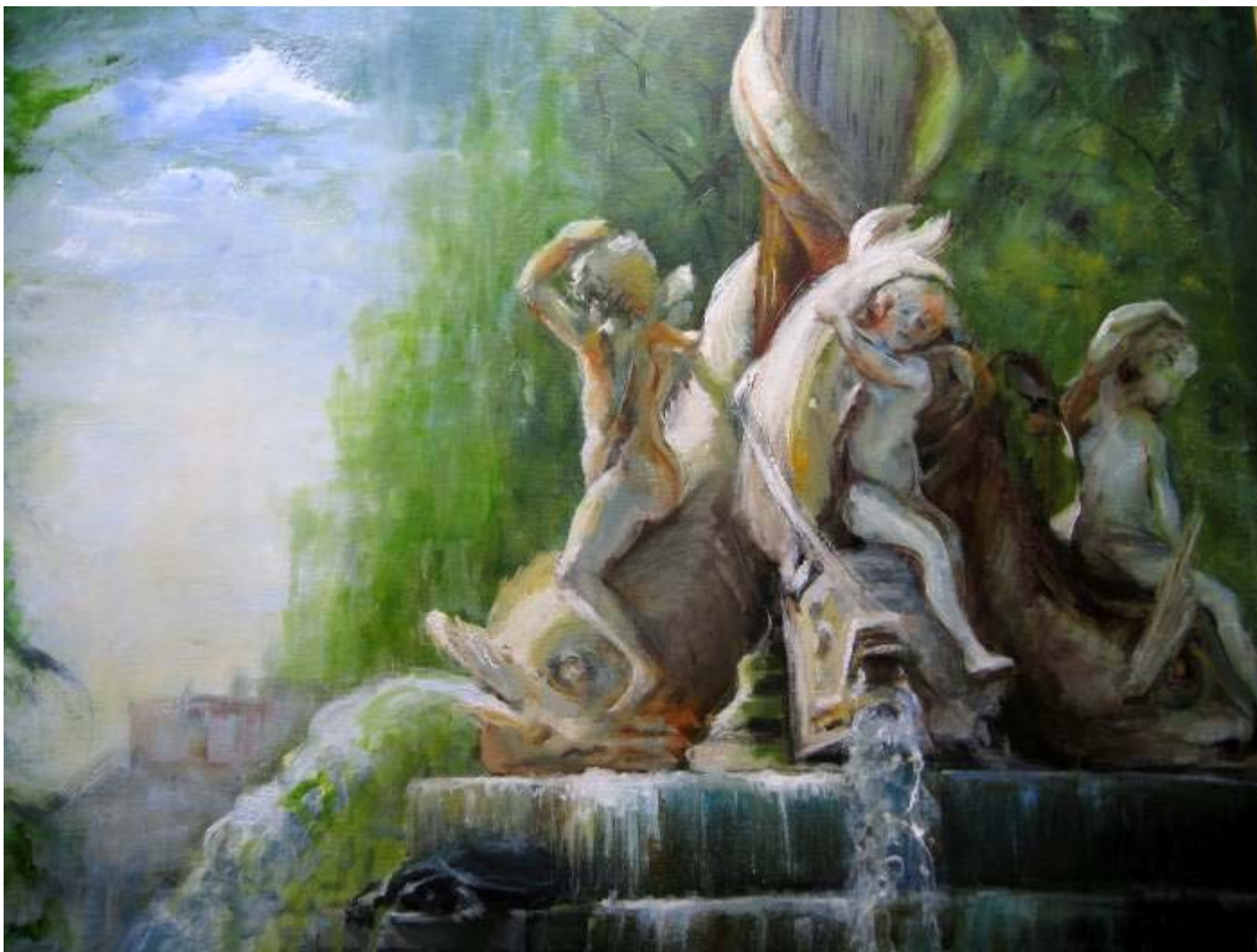
Humildad Hernández "Nuestras fuentes" Óleo / lienzo 81 x 65