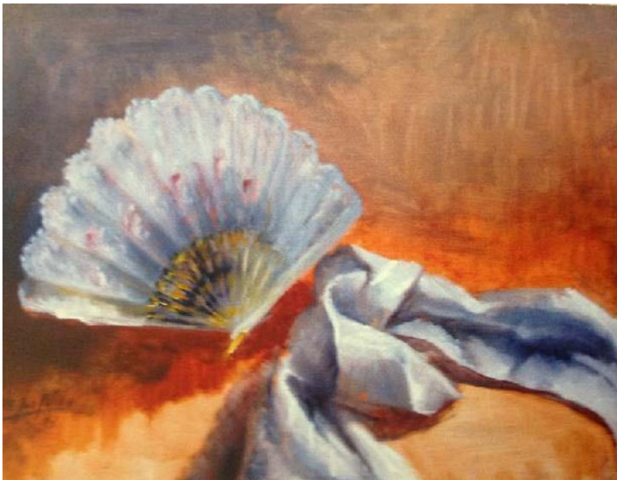
M a Luz Lázaro "Detalles de lucir en los toros" Óleo / lienzo 46 x 61