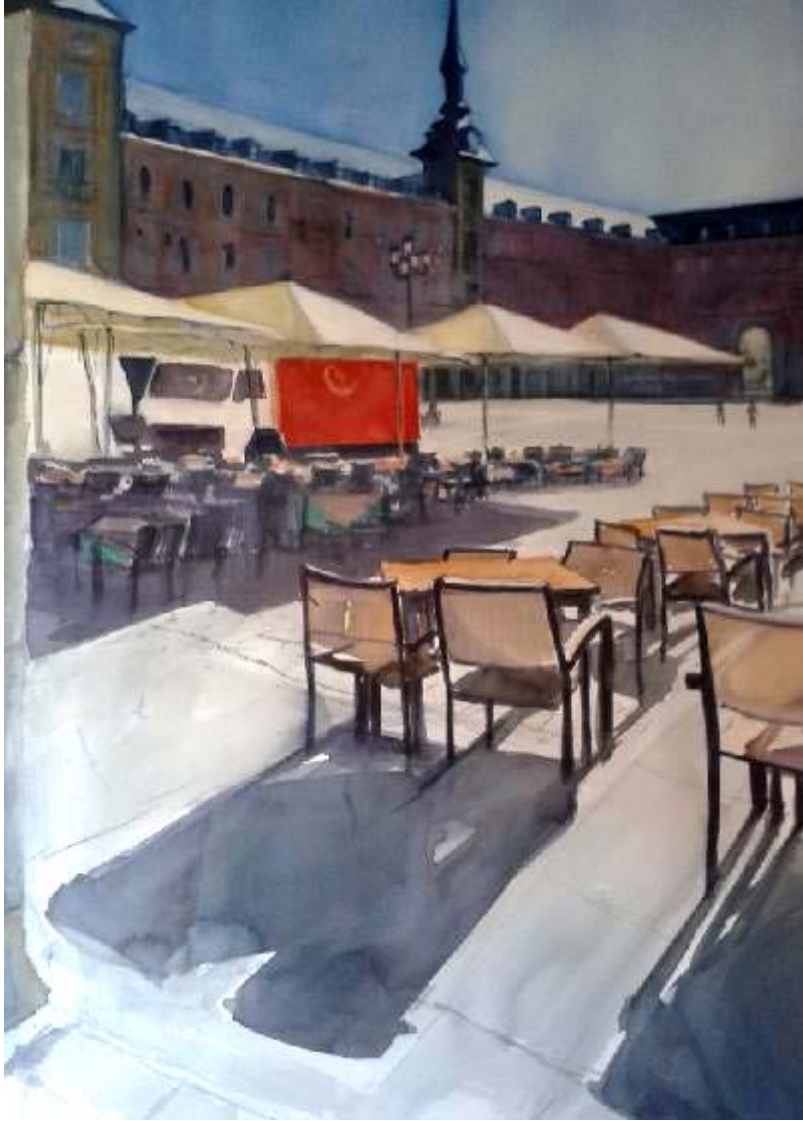
Antonio Ventura Sanz "Plaza Mayor" Acuarela / papel 71 x 52