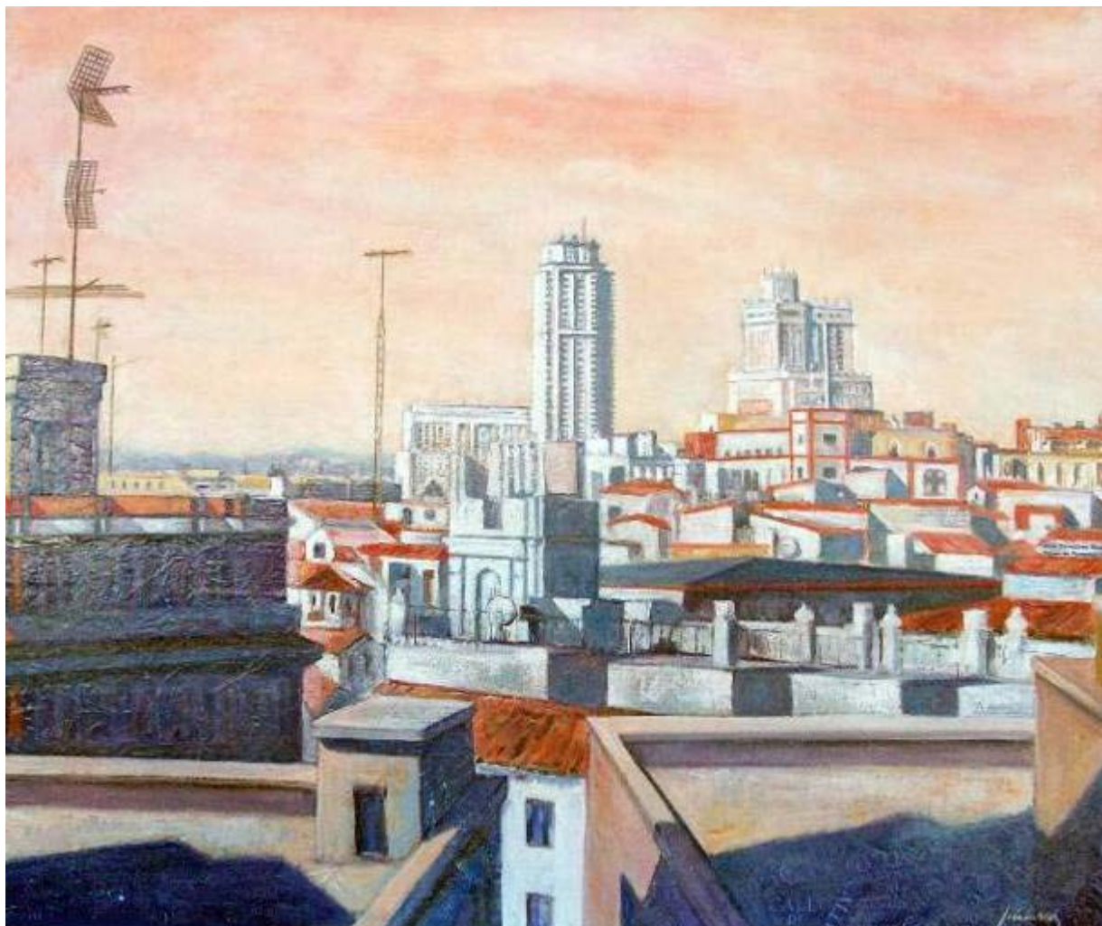
Joaquín Alarcón González "Madrid, bajo la sombra de sus Alcaldes" Mixta / tabla 60 X 73