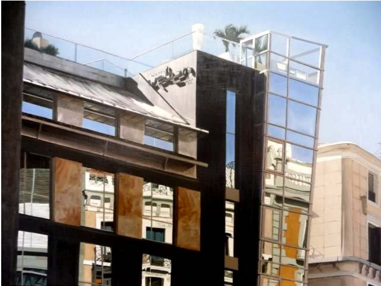
Fernanda Fernández "El Urban" Óleo / lienzo 60 x 81