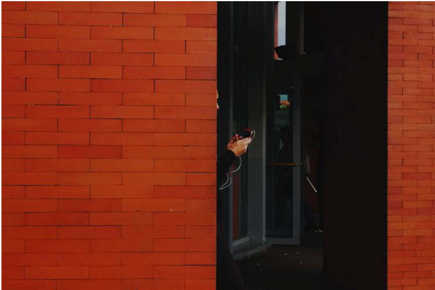
Andreas Strobel "Madrid en cada rincón" Fotografía 50 x 68