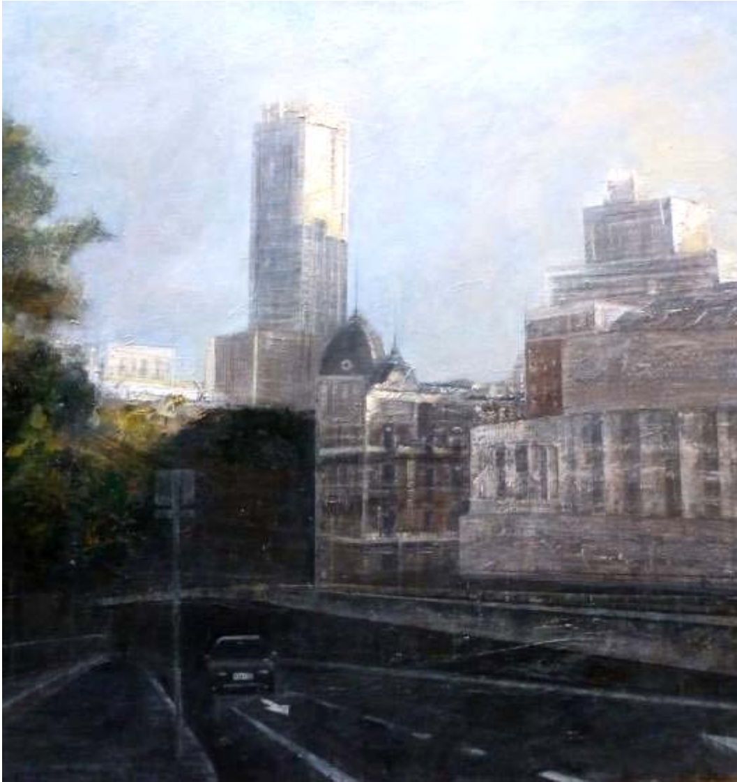
Charo Vaquerizo "Llegando a la Plaza España" Óleo / tabla 70 x 70