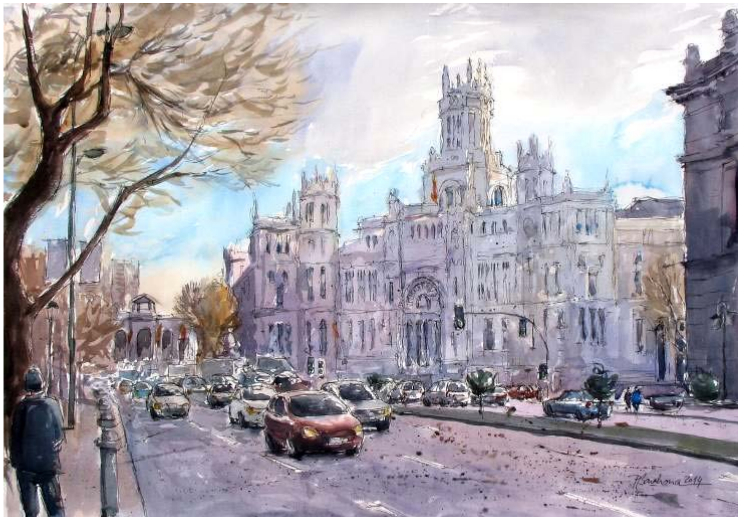
P. Barahona "Palacio de Cibeles" Acuarela / papel 50 x 70