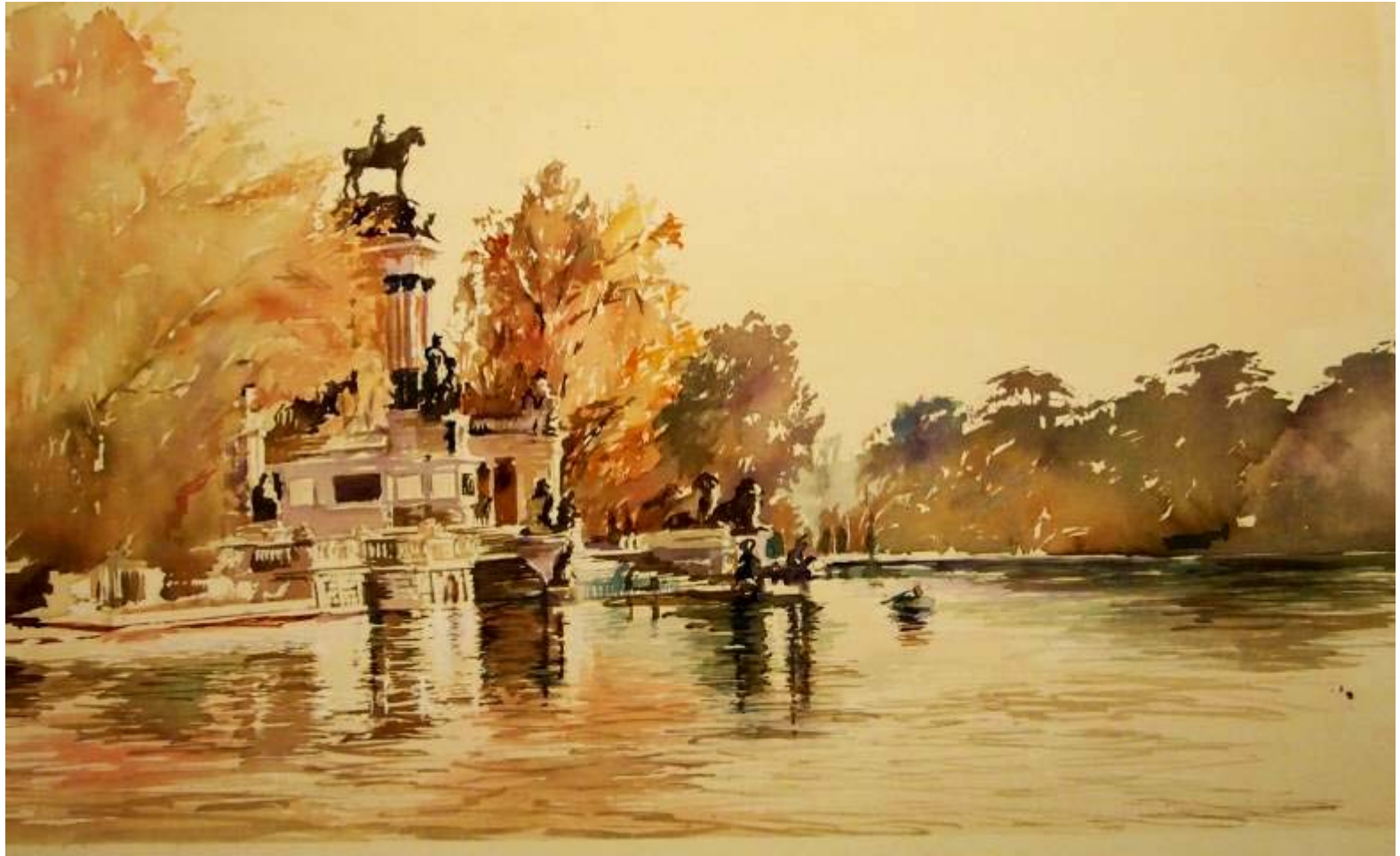
Beatriz de Bartolomé "En el Retiro" Acuarela / papel 60 x 90