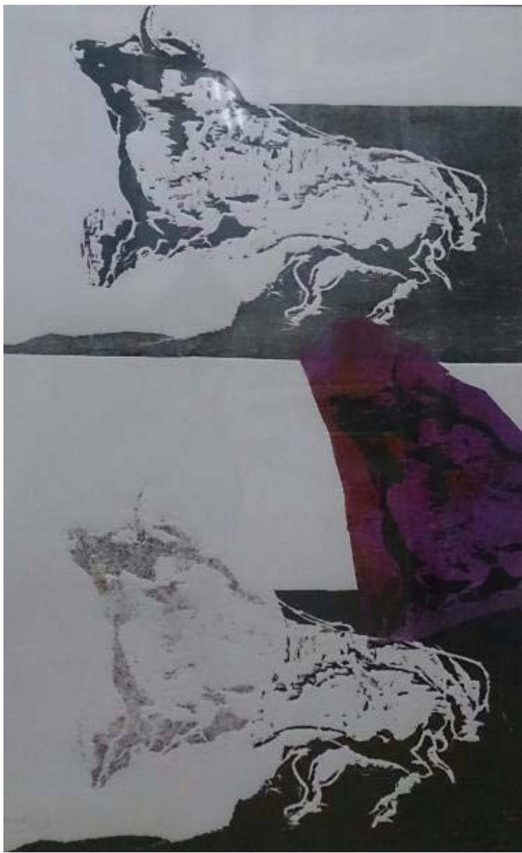
Araceli Aparicio "Por San Isidro: Toros II" Grabado 70 x 50