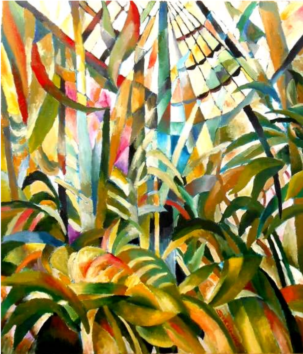
Miguel Sokolowski "Estufa de las palmeras" Óleo / lienzo 73 x 60