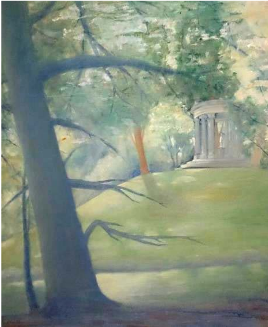
Mercedes Martí Castelló "Parque El Capricho" Óleo / lienzo 73 x 60