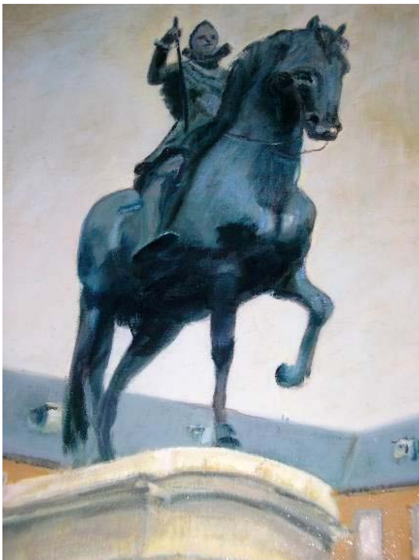
Eulalia Peñafiel Cordero "Felipe III, en la Plaza Mayor" Óleo / lienzo 60 x 50