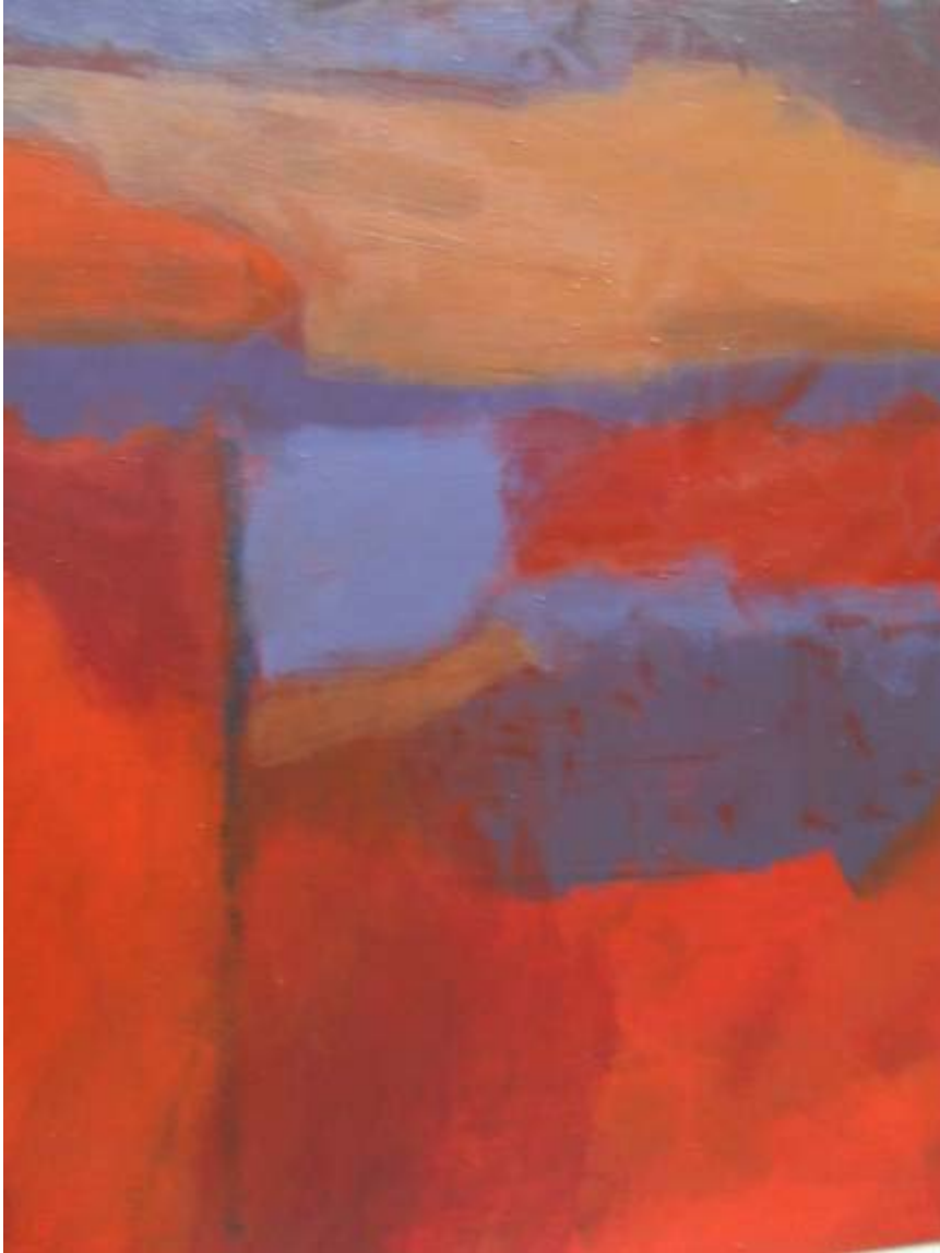
Isabel Garrido "Otoño en la Quinta de los Molinos" Acrílico / lienzo 80 x 80