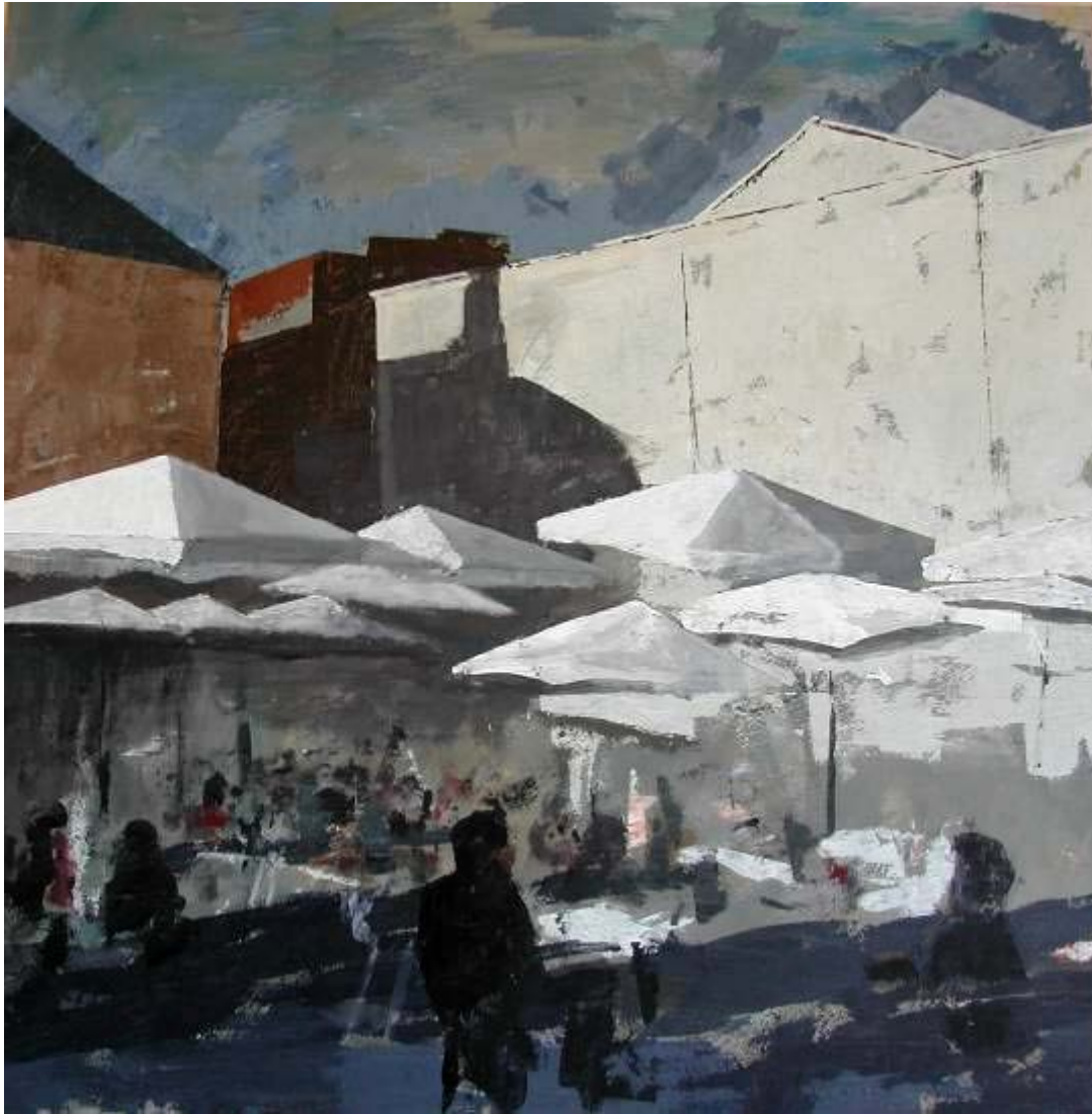
Emilio Sotomayor "Plaza de Santa Ana" Mixta / tabla 81 x 81