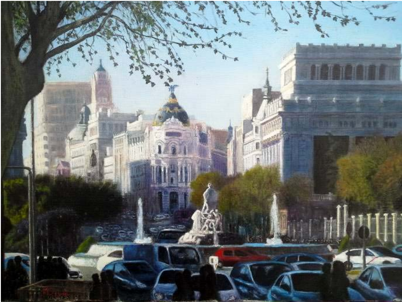
Manuel Segura "Mediodía en Cibeles" Óleo / lienzo 80 x 60