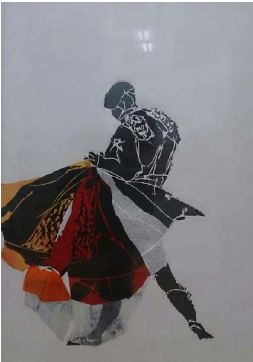
Araceli Aparicio "Por San Isidro: Toros I" Grabado 70 x 50